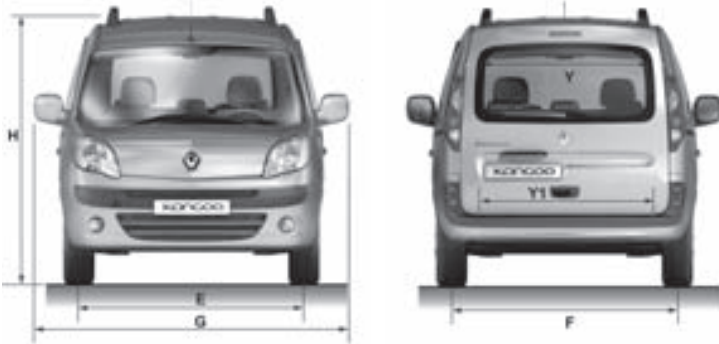
AFMETINGEN (mm) KANGOO II FAMILY